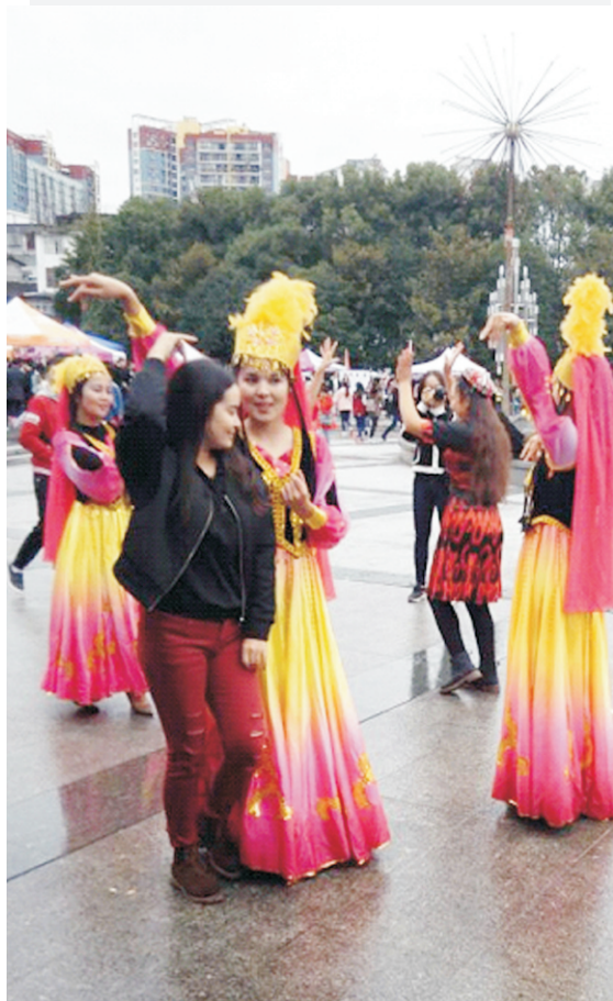
维吾尔族舞蹈展示