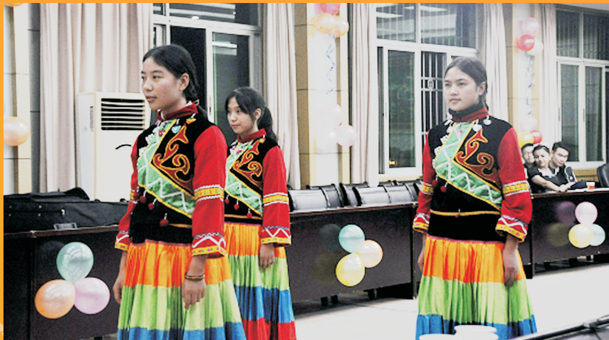
少数民族同学表演民族舞蹈