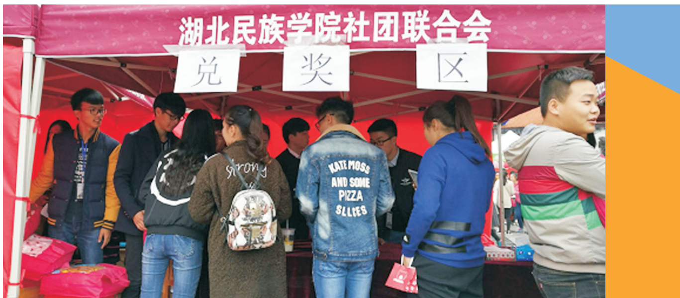
等待兑奖的同学们