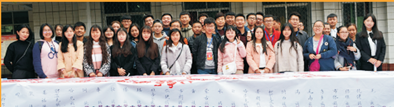
我们一起绘民院之美·聚民族之情