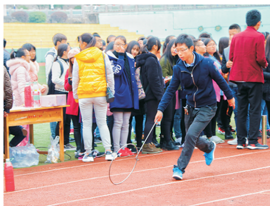
民族传统体育项目——滚贴环