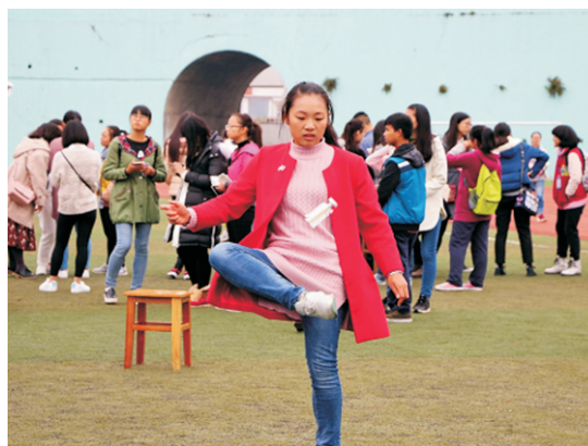
民族传统体育项目——蹴球