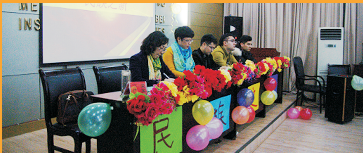
评委老师认真观看表演

11月18日，医学院举办第二届“民族之新”特色活动。活动为各民族同学展现文化艺术提供了一个广阔的舞台，也增进了同学们对各民族文化知识的了解。