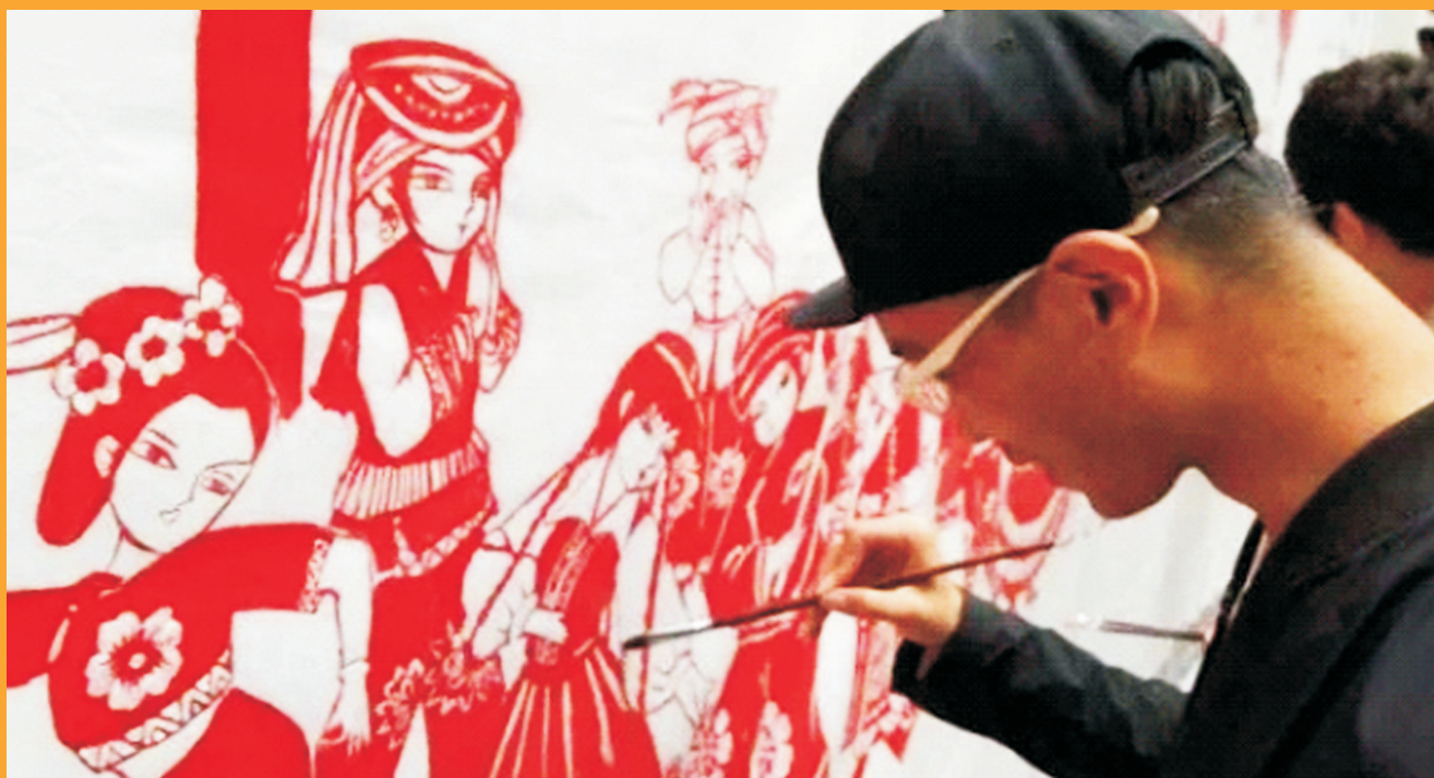
百人绘制民族风情画创作中