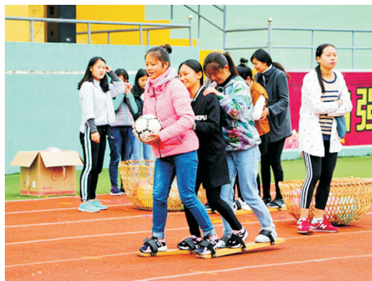
民族传统体育项目——板鞋